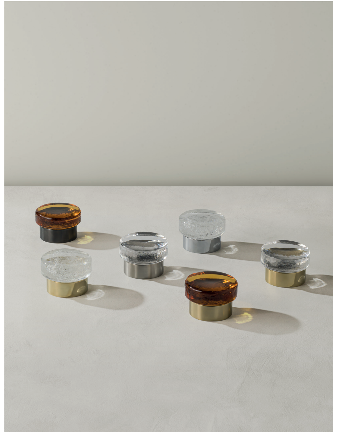
↑ Manopole in vetro puro, vetro ambra e vetro pulegoso abbinato alle diverse finiture dell'ottone Handles in pure glass, amber glass and pulegoso glass combined with the different finishes of the brass