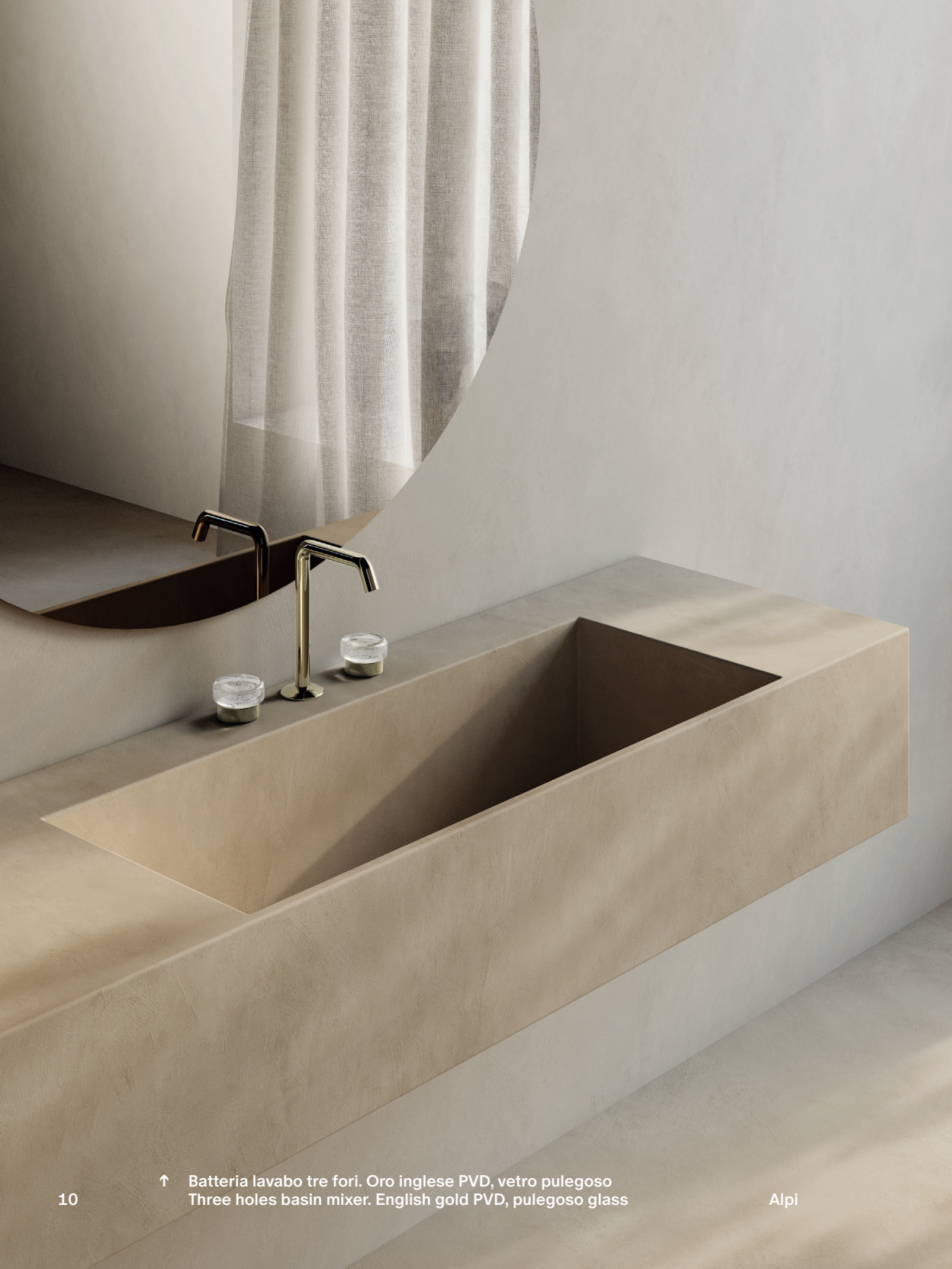
↑ Batteria lavabo tre fori. Oro inglese PVD, vetro pulegoso Three holes basin mixer. English gold PVD, pulegoso glass